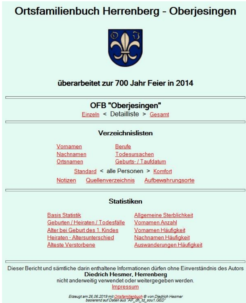
Abb.1: Verzeichnis Übersicht

Durch Aufruf der Datei " _ofb#index.html " (das Zeichen # steht für den Typ des OFB, der Dateiname kann über den Schaltknopf "Einstellungen" geändert werden – siehe Handbuch Teil 2) im Browser wird die Seite Übersicht des OFB geöffnet. Von hier kann zu den Einzeldateien, der Gesamtdatei, zu den Verzeichnislisten, zum Quellenverzeichnis, den Statistiken, einer Vorwortdatei oder der Datei mit den Datenschutz Regeln navigiert werden.