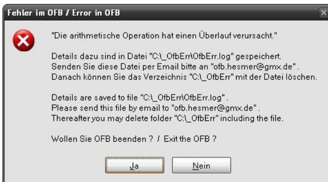
Abb.21: Fehlernachricht "unerwarteter Fehler"

Bei Auftreten eines Programmfehlers überprüfen Sie als erstes, ob Sie die neueste OFB Version verwenden. Falls nicht, installieren Sie diese und wiederholen die Auswertung. Ist der Fehler immer noch vorhanden, so gehen Sie wie folgt vor. Bei Auftreten eines "unerwarteten Fehlers" während der Programmausführung werden die Fehlerdetails automatisch in die Datei "C:\_OfbErr\OfbErr.log" geschrieben, das Verzeichnis dazu angelegt und das Nachrichten Fenster wie in Abb.21 angezeigt. Bitte schicken Sie diese Datei per Email zur weiteren Fehleranalyse an "ofb.hesmer@gmx.de" . Teilen Sie darin die verwendete Programmversion mit und alle