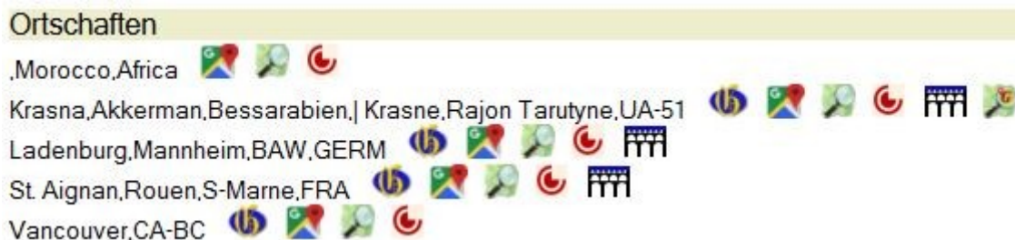
Abb.5: Ausgabe Rubrik "Ortschaften"

Die Liste der Ortschaften mit den Links zu den externen Datenbanken und Kartensystemen ist nur bei dem OFB Typ 3 möglich, da nur hier jede Person eine eigene lfd. Nummer hat. Zusätzlich darf die Drucker Optimierung nicht aktiviert sein. Die Ausgabe erfolgt nur in den Einzeldateien , nicht in der Gesamdatei. Jedes Icon ist ein Link zu dem entsprechenden System. Die jeweiligen Icons werden nur ausgegeben, sofern entsprechende Daten für die Orte in der ged-Datei enthalten sind. Für das GOV System des CompGen muss der Tag _GOV mit dem GOV Kennzeichen, für die Kartensysteme die Tags MAP mit LATI (Breitengrad) und LONG (Längengrad) enthalten sein. Für diese Daten werden die Unter-Tags von PLAC und, sofern vorhanden, auch vom _LOC Datensatz ausgelesen.